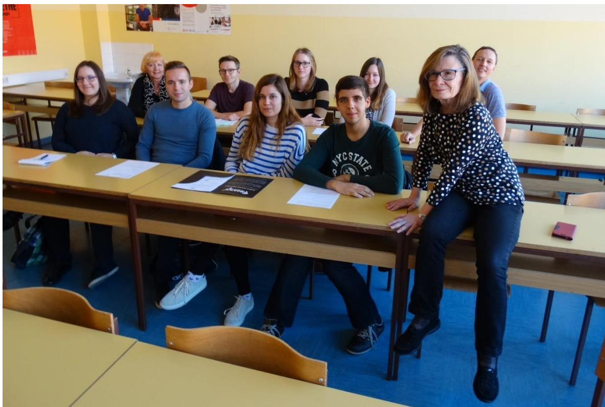
Slika 2: Študenti in pedagoški mentorji FF UM