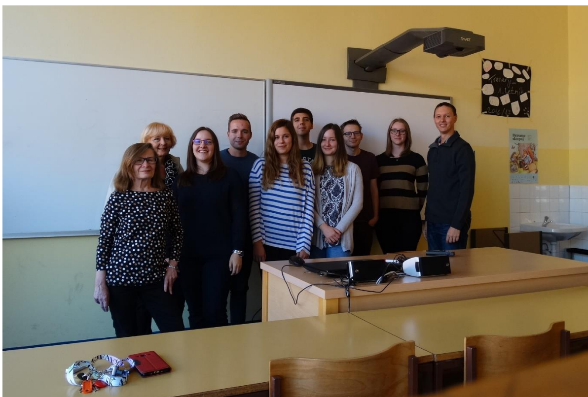
Slika 3: Študenti in pedagoški mentorji FF UM